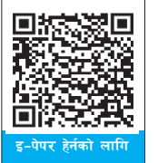
इ-पेपर हेतको लागि