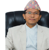
मुद्दा दायर गरेको थियो। अख्तियारले एक अर्ब ४७ करोड १० लाख ८५ हजार चार सय ८२ रुपैयाँ रकम बिगो माग्दाबी प्रश्न गरेको थियो।