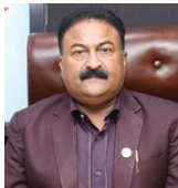
अख्तियार दुरुपयोग अनुसन्धान आयोगको कार्यन्वयन गर्नुपर्ने सरकारी निकायले अदालतको फैसलालाई कार्यान्वयन नगरी सिंहदरवारका मन्त्री, सचिव र पूर्वमन्त्री संलग्न भ्रष्टाचारको छानबिनलाई मात्र तीव्रता दिएको छ।

तीनै तहको अदालतको फैसला कार्यान्वयन गर्नुपर्ने सरकारी निकायले अदालतको फैसलालाई कार्यान्वयन नगरी सिंहदरवारका मन्त्री, सचिव र पूर्वमन्त्री संलग्न भ्रष्टाचारको छानबिनलाई मात्र तीव्रता दिएको छ।